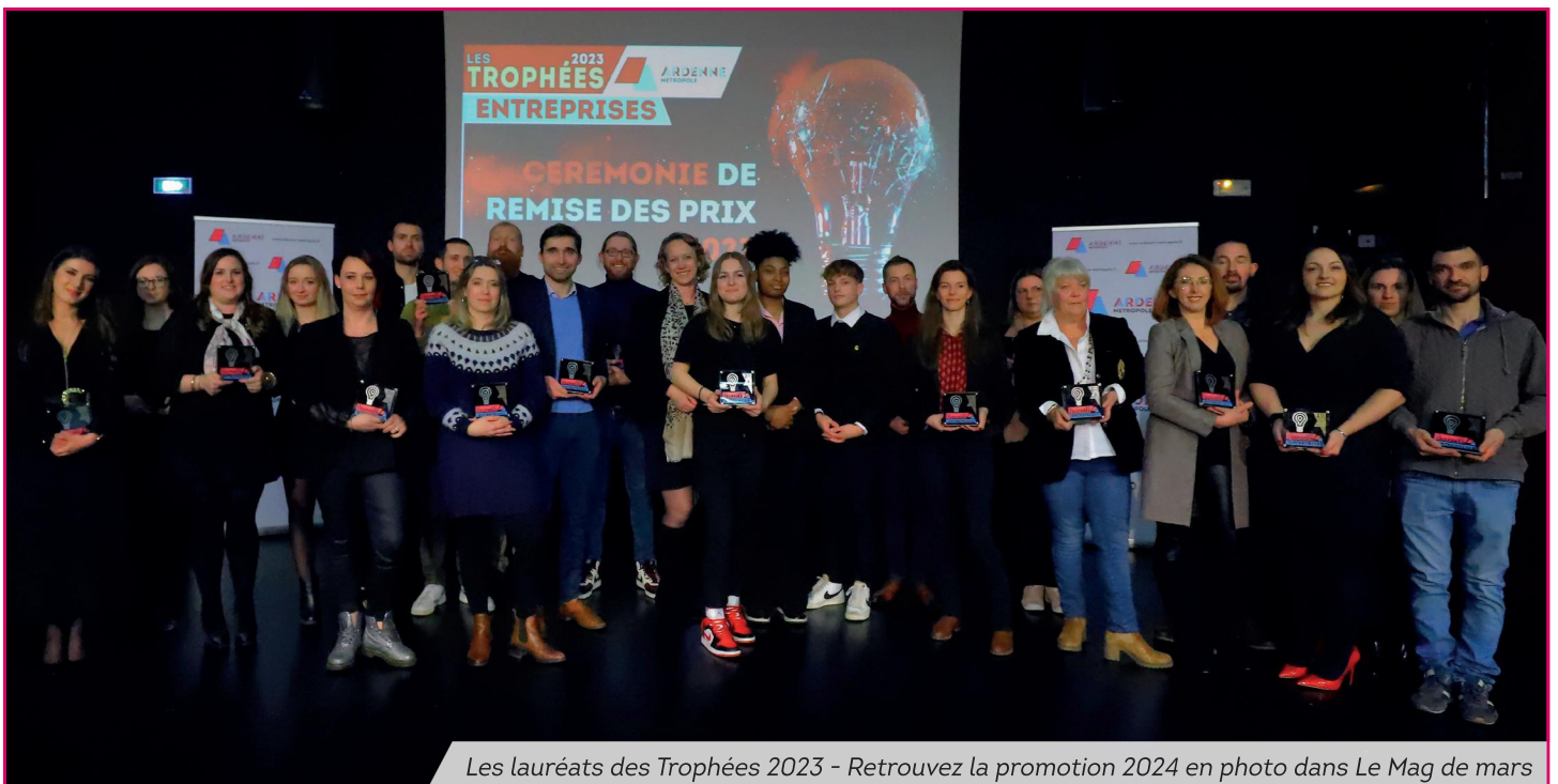
Les lauréats des Trophées 2023 - Retrouvez la promotion 2024 en photo dans Le Mag de mars

Flashez-moi et découvrez toutes nos promos